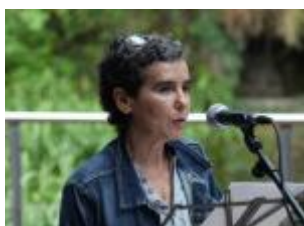
Arenas (Cabrales) 1960