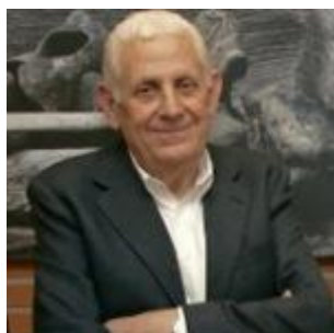
Pumarabule (Siero) 1935