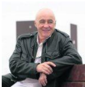
Zarracín (Tinéu) 1957